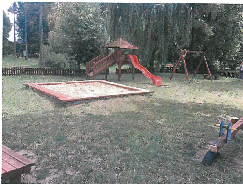
Istniejący plac zabaw (przeznaczony do demontażu)

Działka o numerze 112/13 obejmuje tereny parkowe oraz rekreacyjne. Stanowi własność Gminy Gozdowo. W jej obrębie znajduje się ogrodzony plac zabaw, w którego skład wchodzi zestaw zabawowy, huśtawki oraz piaskownica. Plac zabaw zajmuje powierzchnię ok. 678,00 m 2 .