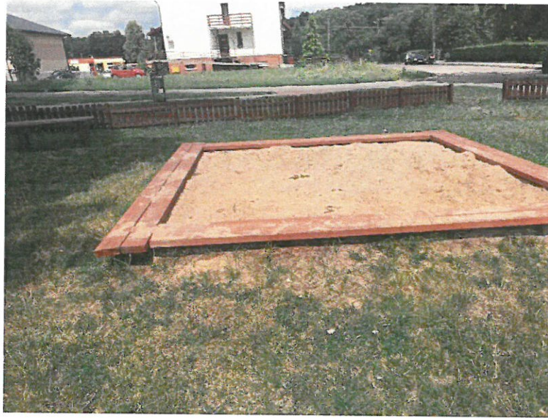
Istniejąca piaskownica przeznaczona do demontażu.